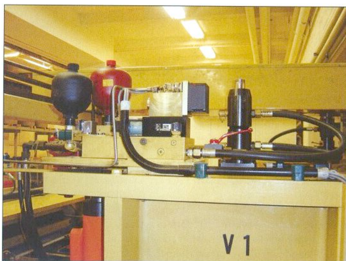
Bilden visar ventilblock med servoventil fabrikat Schneider och den klippcylinder den manövrerar. Saxen är försedd med ett antal sådana enheter.