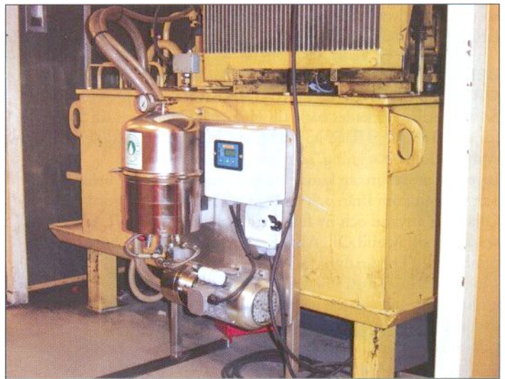
Efter installation av cirkulationskrets fabrikat Europafilter med flöde ca 1,1 l/min fungerar saxen som den ska. Cirkulationskretsen är försedd med en flödesmätare som används för att indikera när byte av filterinsats bör göras. Europafilter och den speciella filterinsats, som fungerar enligt vad som kan kallas en kapillärprincip, är beskriven i en artikel i nr. 1-2004 av Fluid scandinavia. Enligt tillverkaren avskiljer insatsen partiklar ned till storlekar på 0,1 µm och därmed också oxidationspartiklar.

syral och viskositet mellan ny och använd olja. Däremot innehöll oanvänd olja Zink och Kalcium, som inte kunde återfinnas i använd olja. Spår av både Zink och Kalcium fanns i "klegget". Man noterade också att det var problem att filtrera oanvänd olja genom 0,8 µm analysfilter, som satte igen efter halva mängden olja medan motsvarande problem ej fanns med använd olja. Oanvänd olja av den typ som tidigare användes i systemet, Mobil HP 46N undersöktes. Den innehöll inte Zink och Kalcium.